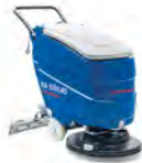
RA 55 K 40