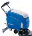
RA 55 BM 40