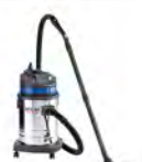
SW 30 S SW 53 S