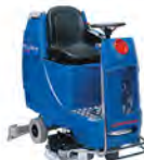
ARA 80 BM 100