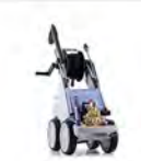
Quadro 599 TS T Quadro 799 TS T