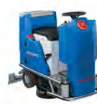
ARA 66 BM 70