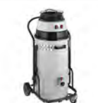
MISTRAL 202 DS