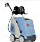
Therm C 11/130 Therm C 13/180