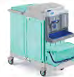
AB-Plus alpha dosing