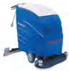
RA 66 KM 60