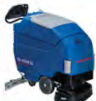
RA 66 BM 60